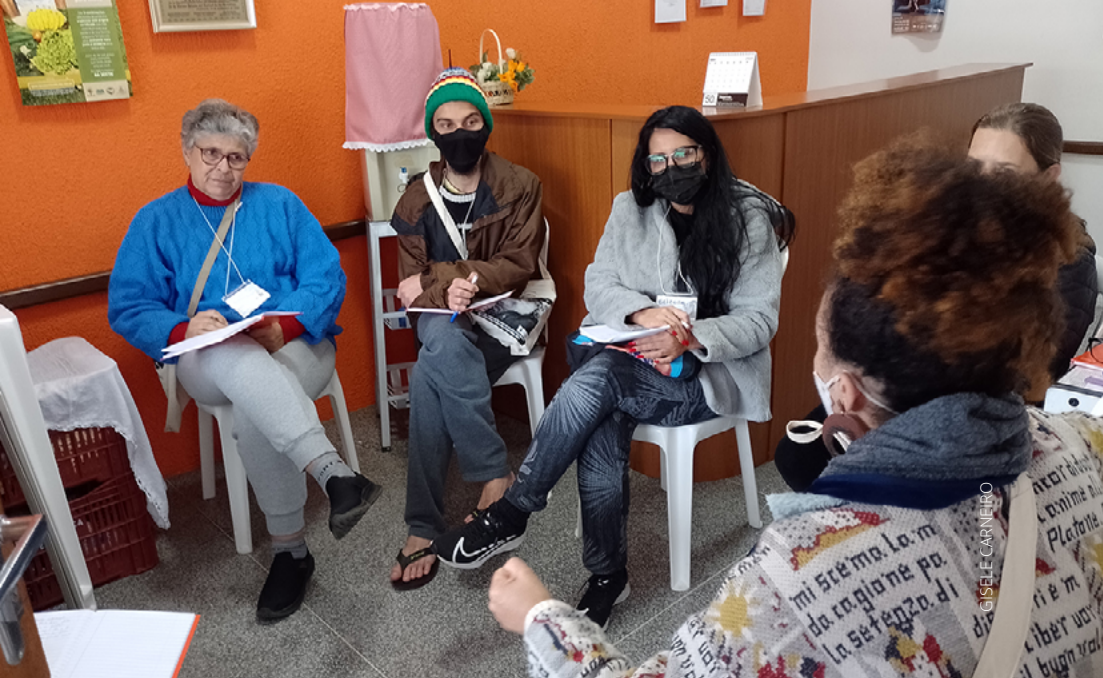
MOMENTO DE DISCUSSÃO EM GRUPO COM PARTICIPANTES DA 1ª ETAPA DA ESCOLA DE FORMAÇÃO BÁSICA MULTIPLICADORA EM ECONOMIA POPULAR SOLIDÁRIA. 27/06/2022. CECOPAM. CURITIBA-PR

Pensar coletivamente é diferente de pensar apenas para si, para alguém ou para um grupo. A transformação ocorre por meio das construções coletivas.