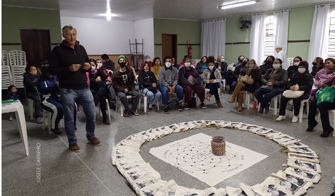
1ª ETAPA DA ESCOLA DE FORMAÇÃO BÁSICA MULTIPLICADORA EM ECONOMIA POPULAR SOLIDÁRIA. 27/06/2022. CECOPAM. CURITIBA-PR

Como exemplo, citamos o mito neoliberal da “mão invisível do mercado”, segundo o qual o mercado seria sábio o suficiente para organizar toda a ordem social, bastando para isso, deixá-lo em liberdade e alimentá-lo. Esse argumento fundamenta a retirada do Estado em questões sociais, como saúde, educação, assistência, etc. abrindo o caminho para as privatizações. Você concorda que o mercado tem uma mão invisível que tudo organiza? A mão do mercado não busca o bem viver ou o bem comum, está à procura do lucro.